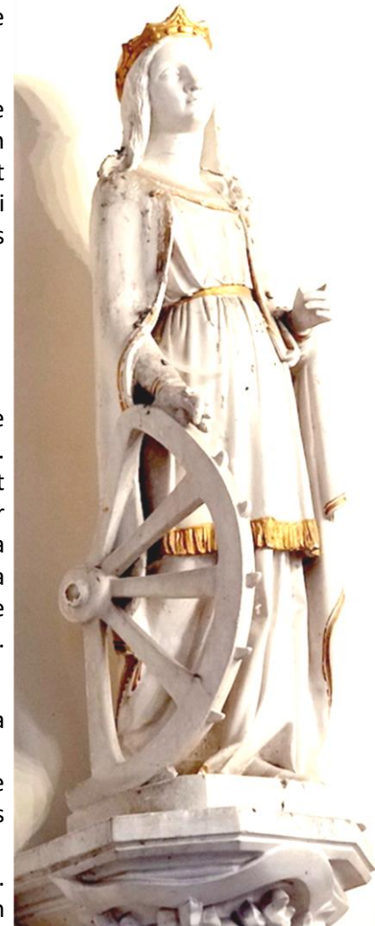
Eglise Saint Martin à Misy-sur-Yonne (77)

L'empereur lui infligea ensuite le supplice de la roue. Un ange du Seigneur la sauva. Catherine fut alors décapitée, à l'âge de 18 ans. Des anges s'emparèrent de son corps et le déposèrent sur la montagne. Il en coulait une huile sainte qui guérissait les malades.