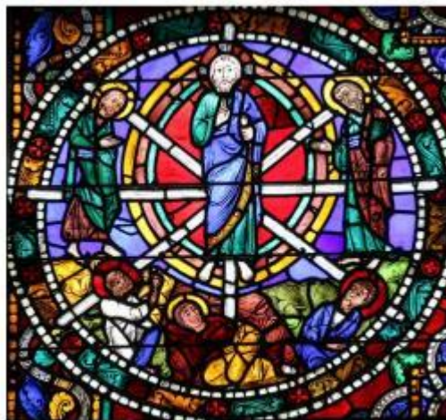
Transfiguration vitrail cathédrale de Chartres 28 France

Je vous quitte mais ne vous oublierai pas dans ma prière. Comme le dit le titre d'un magnifique film vu récemment entre prêtres : « je n'oublierai jamais vos visages ».